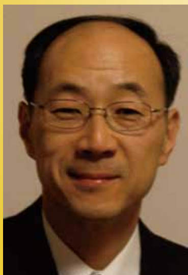
東京慈恵会医科大学附属第三病院 リハビリテーション科